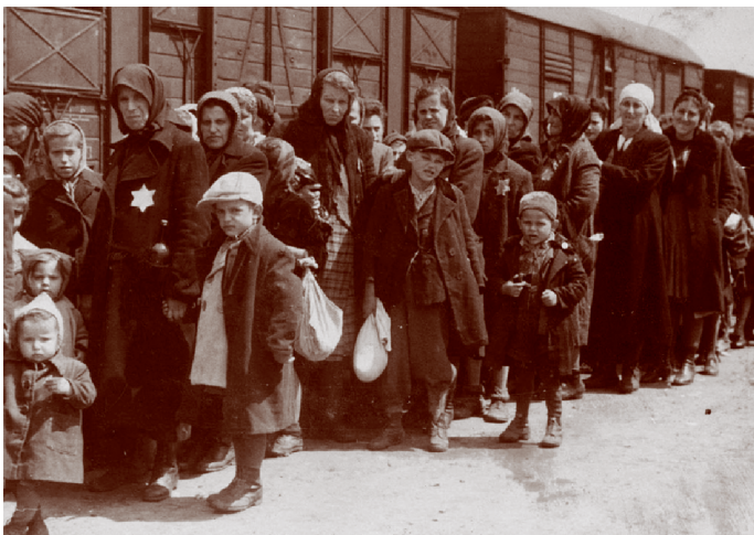
A zsidóság tragédiája

Ezen érvek nagy súllyal estek latba fiatalkori életem kialakul-