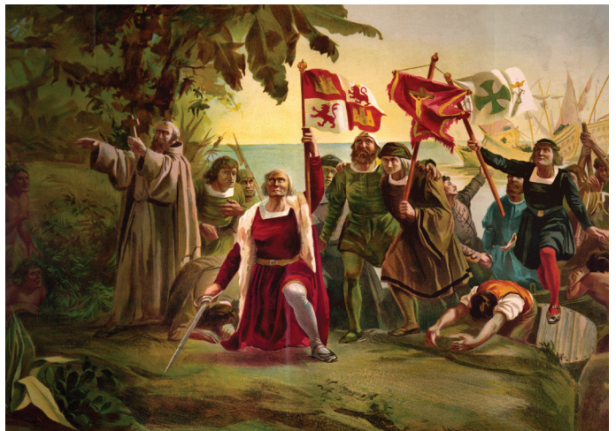
Kolumbusz Kristóf partra száll

Ám Isten kegyelméből, '89 augusztusában találkoztam azzal a