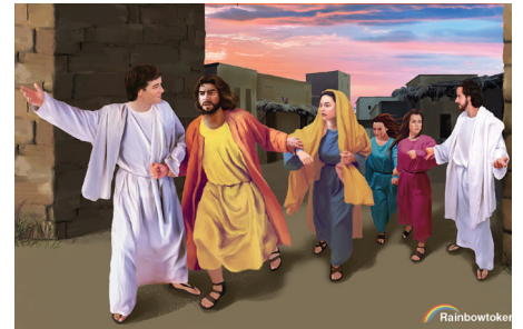
Lótot és családját angyalok vezetik ki Szodomából

Nem kell nyíltan Astartét, Baált, Kübelét, Kémost, az Ápisz-bikát, esetleg más, régi vagy mai pogány isteneket imádni; elég ha életmóddunkkal azt bizonyítjuk, hogy emez – valójában csak hamis, emberek képzeletében létező – „istenek” mögött rejlő démoni lelkekre hallgatunk.