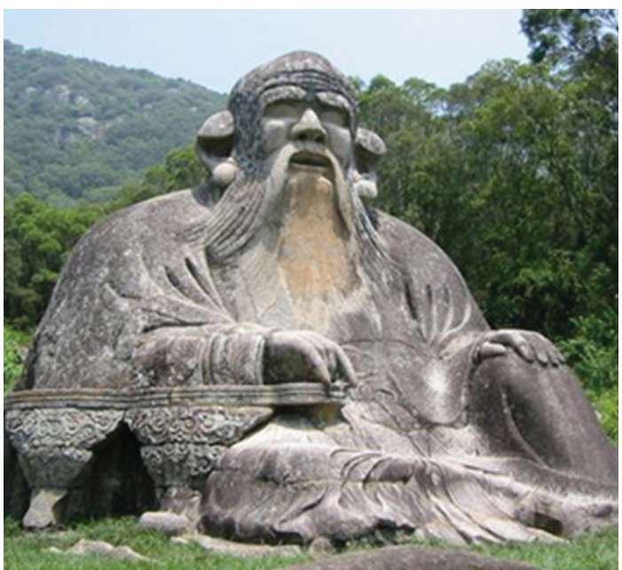
A Taoizmus megalapítójának, az i.e. 4-ik században élt Lao Ce-nek a szobra Kínában

Mindezek után ajánlatos a valódi, tudományos alapú orvoslásra hagytakozni , melyhez természetesen nem csak a gyógyszerek, műtétek és más klinikai beavatkozások tartoznak, hanem a helyes táplálkozást és mozgást magába foglaló egészséges életmód, a gyógynövények ésszerű használata, valamint a balneológiai kezelések is (masszázs, gyógyfürdők,