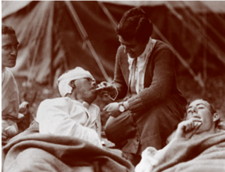
Elő világháború – dohányozó sebesültek