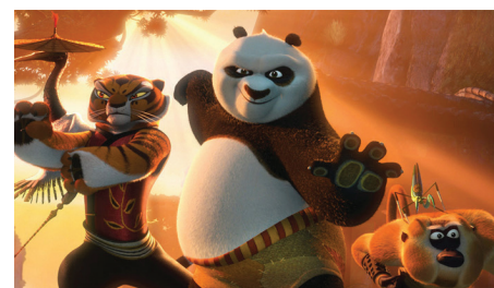
Kung fu panda

Van, aki hajlamos mindezt azonnal elhinni, és alávetni magát az ilyen kezeléseknél már csak a kelet varázsa miatt is, amit a számos, keleti harci művészeteket megenergiaelmeleteket – nyíltan vagy burkoltan – reklámozó film és rajzfilm is erősít (pl. Bruce Lee vagy Jackie Chan filmek, Csillagok háborúja, Kung Fu Panda stb.)