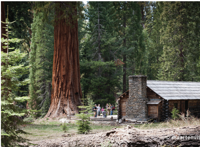
Ősrégi Sequoia fenyők alatt