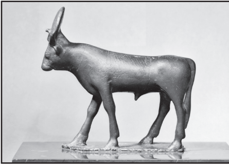
Egyiptomi Ápisz bika

Amikor valaki hinni kezd Krisztusban, akkor a Bibliában – mind az Ó, mind az Újszövetségben – bemutatkozó igaz Isten gyermekévé válik: