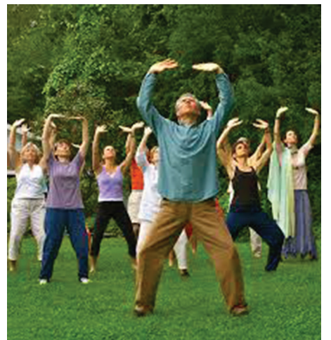
Thai Chi Gong gyakorlók

Másként történt ez Keleten. Amikor kiderült, hogy az ember testében semmiféle pályák mentén nem kering levegő, nyák és epe, sőt sem-