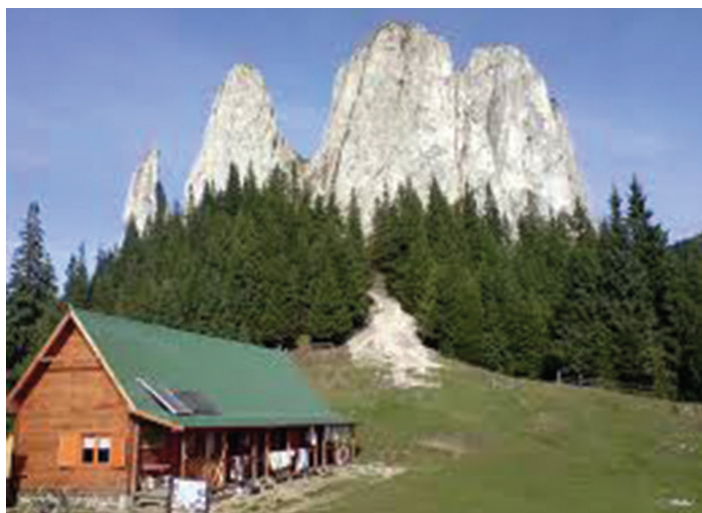
Egyes-kő, a Nagyhagymás-hegységben