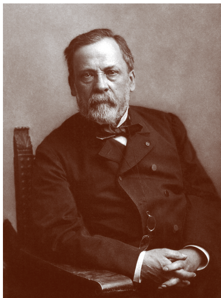
Louis Pasteur (1822–1895)