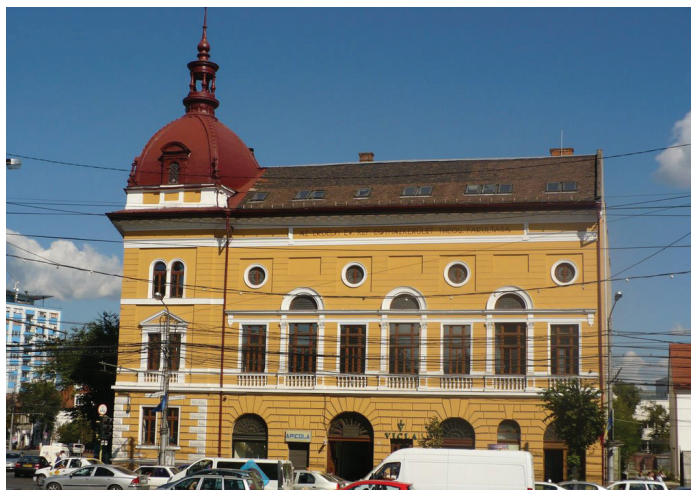
Protestáns Teológia, Kolozsvár

Ekkor mesélni kezdett nekem egy nemrég olvasott könyvből, amelyet egy holland biológus írt, aki teremtéshívő volt és rovarkutató. Ebben szó volt többek között a hangyákról: hogyan zajlik életük a bolyban, milyen a felépítésük, milyen érdekes és bonyolult minden velük kapcsolatban... Világosan látszik hát, hogy nem