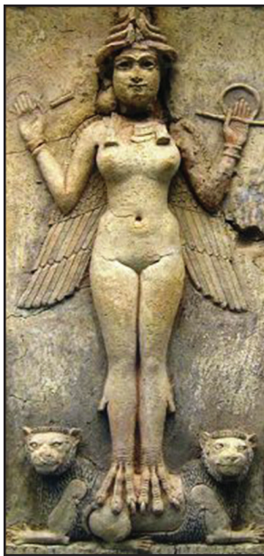
Astarté egyiptomi istennő

A megtérő kereszténynek az első parancsolat fényében biztosnak kell lennie abban, hogy meg-